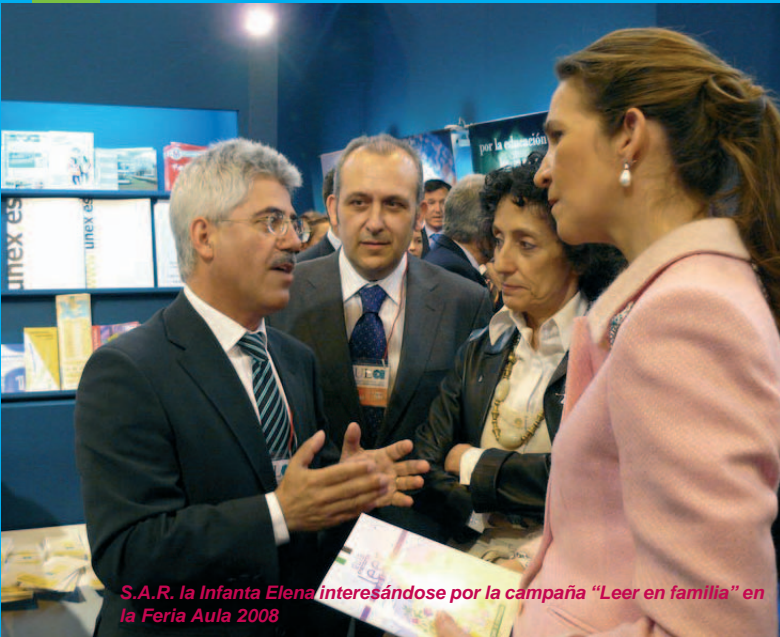
S.A.R. la Infanta Elena interesándose por la campaña “Leer en familia” en la Feria Aula 2008

ÉXITO DE LA CAMPAÑA “LEER EN FAMILIA”. LA CONSEJERÍA DE EDUCACIÓN HA TENIDO QUE AMPLIARLA HASTA 15.681 FAMILIAS DEBIDO A LA DEMANDA RECIBIDA